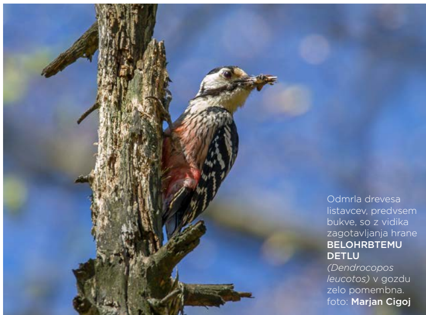
Odmrila drevesa listavcev, predvsem bukve, so z vidika zagotavljanja hrane BELOHRBTEMU DETLU ( Dendrocopos leucotos ) v gozdu zelo pomembna.